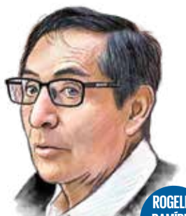
ROGELIO RAMÍREZ DE LA O